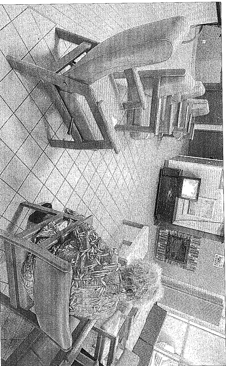
Les troubles de la mémoire font immédiatement penser à la maladie d'Alzheimer. Or, ce n'est pas obligatoire.